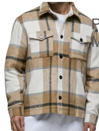
РУБАШКА-КУРТКА МААГ -5999